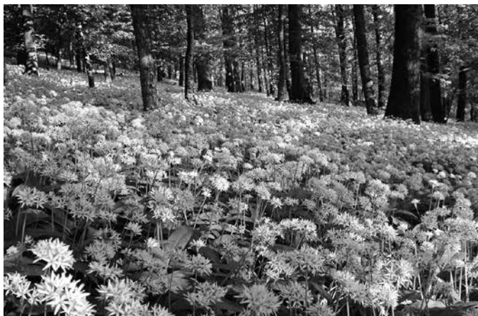
Ein Bärlauch-Blütenmeer im Wald. Erkennungszeichen von Bärlauch ist der typische Knoblauchgeruch.