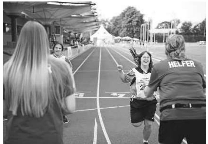
Special Olympics Baden-Württemberg ist auf Helfersuche für die größte inklusive Sportveranstaltung 2025 – die Special Olympics Landesspiele 2025 in Heilbronn und Neckarsulm