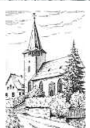
Evangelische Kirche Frankenbach

SV Heilbronn am Leinbach 1891 · www.svhn1891.de