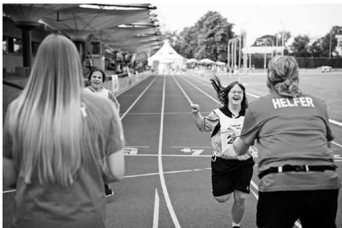
Special Olympics Baden-Württemberg ist auf Helfersuche für die größte inklusive Sportveranstaltung 2025 – die Special Olympics Landesspiele 2025 in Heilbronn und Neckarsulm