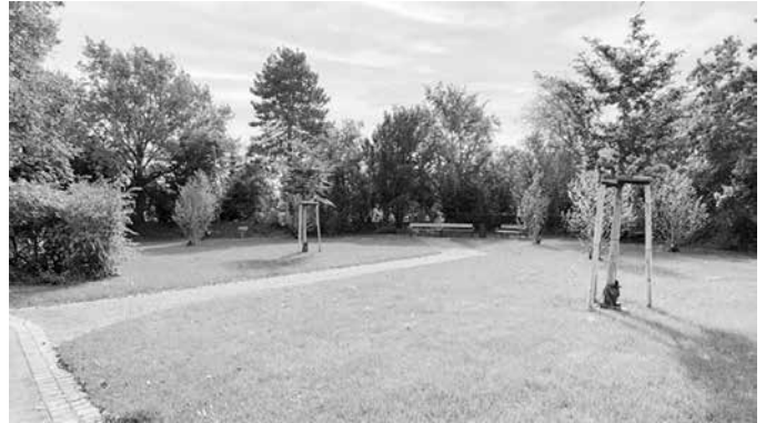
Neun Magnolien zieren den Magnolienhain – eins der neuen Grabfelder.

Erst im Oktober war der Südfriedhof in Sontheim dazukommen. Für die Inbetriebnahme der neuen Grabfelder auf dem Frankenbacher Friedhof hat der Gemeinderat in seiner Sitzung am heutigen Montag, 16. Dezember, der Anpassung der Friedhofsatzung zugestimmt.