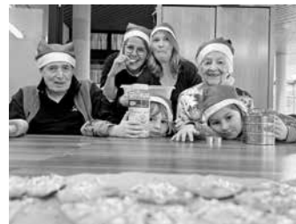
Gemeinsame Backaktion

Das Pflegeheim Katharinenstift und das Familienzentrum Olga-krippe werden für ihre langjährige Kooperation „Kleine Hände, große Herzen: Generationenübergreifende Begegnungen“ mit dem Heilbronner Bürgerpreis 2024 geehrt. Die Initiative verbindet seit 30 Jahren Kinder und Seniorinnen und Senioren in regelmäßigen Begegnungen.