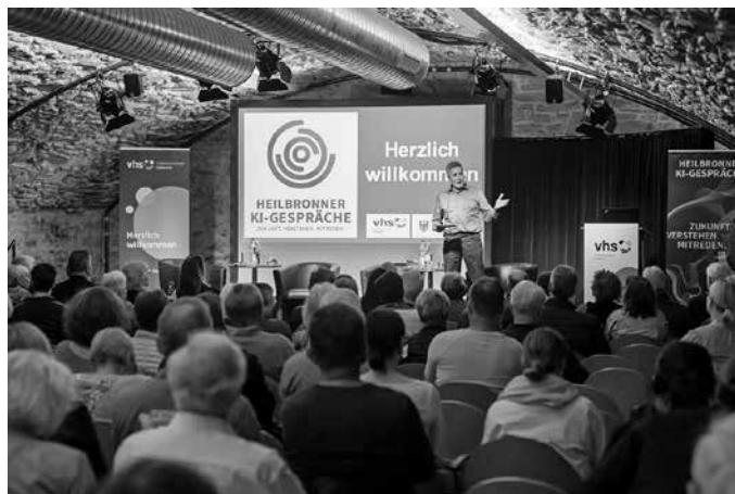
Die Reihe „Heilbronner KI-Gespräche“ von Volkshochschule und Stadt Heilbronn startet am 7. Oktober mit einem Fokus auf KI und Ethik.

Weitere Infos und Anmeldung für alle Termine via Internet über www.heilbronn.de/ki-gespraech , unter der VHS-Telefonnummer 07131/9965-0 oder per Mail an info@vhs-heilbronn.de .