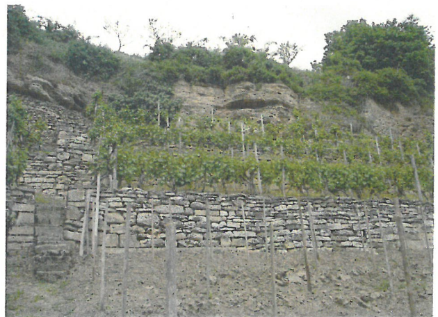
Abb. 4: Im Bereich des Naturdenkmals Felsendiluviale dienen Nagelfluh-Felsen und Trockenmauern der Mauereidechse als Lebensraum. Gerade die Felsen müssen immer wieder von Gehölzbewuchs befreit werden, um die Besonnung zu gewährleisten. / Fig. 4: Rocks and walls near the natural monument Felsendiluviale serve as habitats, which need regular clearance cutting to ensure high insolation.

der Mauereidechse im Stadtkreis Heilbronn siehe auch HABERBOSCH & MAY-STÜRMER 1987, HELLWIG & HELLWIG 2011). Möglicherweise vernetzt die Bahnlinie, die in Heilbronn den Neckar quert, auf beiden Neckarseiten vorhandene Populationen der Mauereidechse und garantiert somit den genetischen Austausch.