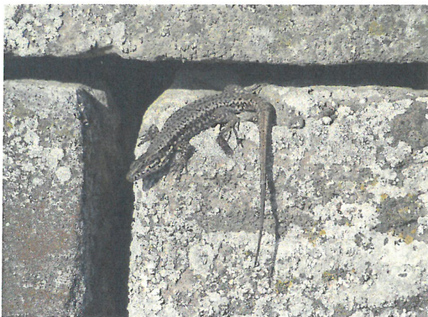
Abb. 2: Mauereidechse an Schilfsandstein-Trockenmauer. / Fig. 2: Common Wall Lizard at a dry stone wall.