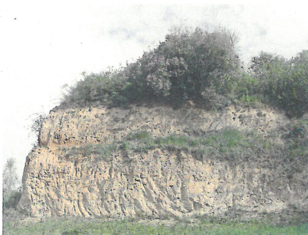
Abb. 6: Sonnenexponierte Lößwände im Ziegeleipark Böckingen sind ebenfalls Lebensraum der Mauereidechse. / Fig. 6: Sun-exposed loess-walls in the Ziegeleipark Böckingen serve as habitats.

von Trockenmauern in wärmebegünstigten Weinberglagen als wichtiger Lebensraum für Mauereidechsen ist nur in Ausnahmefällen möglich. Und so fokussieren sich Biotopmanagementmaßnahmen in erster Linie auf Erhalt der noch vorhandenen Trockenmauern, die meist zudem als Biotop dem gesetzlichen Schutz des Naturschutzgesetzes unterliegen. Die Bewirtschafteter können zur Unterhaltung bzw. Wiederherichtung eingestürzter Mauern eine finanzielle Förderung nach der Landschaftspflegerichtlinie des Landes Baden-Württemberg erhalten. Darüber hinaus führen