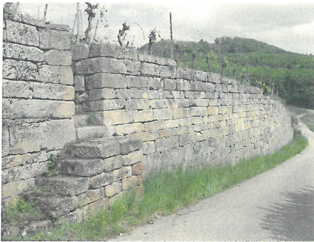
Abb. 1: Schilfsandstein-Trockenmauern in den Weinbergen, wie hier am Staufenberg in Heilbronn-Sontheim, sind typische Mauereidechsen-Habitats in Heilbronn. / Fig. 1: Dry stone walls in vineyards, such as Staufenberg in Heilbronn-Sontheim are typical habitats of the Common Wall Lizard in Heilbronn.