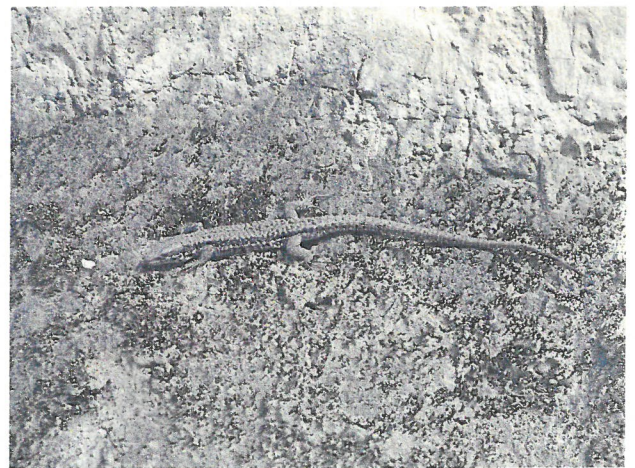
Abb. 7: Mauereidechse an einer sonnenexponierten Lößwand im Ziegeleipark Böckingen. / Fig. 7: Common Wall Lizard at a sun-exposed loess-walls in the Ziegeleipark.