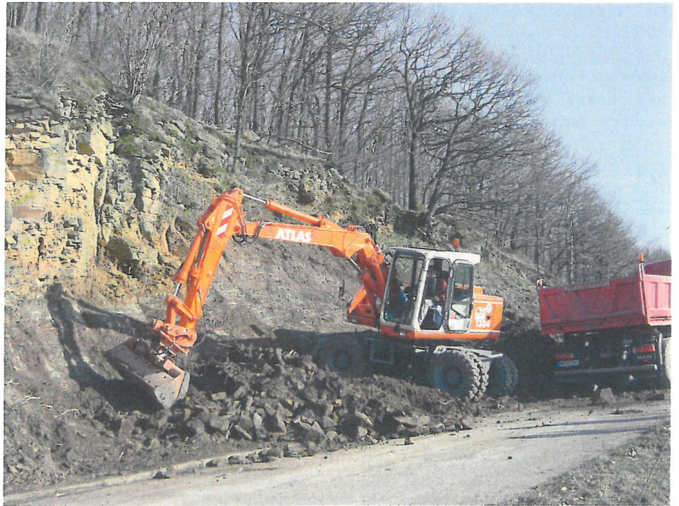
Abb. 5: Mit Baggereinsatz wird an sonnenexponierte Waldrändern im Heilbronner Osten die Gehölzsukzession entfernt und so als Lebensraum für Mauereidechsen wieder hergerichtet. / Fig. 5: With the help of a dredger succession gets removed at the sun exposed forest edges in the east of Heilbronn.

Insgesamt gesehen ist die Mauereidechse im Stadtkreis Heilbronn dennoch nicht selten und punktuell noch in vergleichsweise individuenstarken Populationen vertreten. Die einzelnen Populationen sind allerdings oft mehr oder weniger stark voneinander isoliert (vgl. auch HELLWIG & HELLWIG 2011).