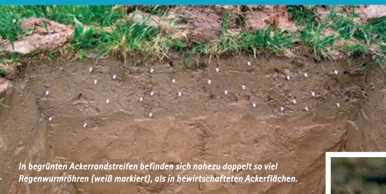
In begrünten Ackerrandstreifen befinden sich nahezu doppelt so viel Regenwürmröhren (weiß markiert), als in bewirtschafteten Ackerflächen.