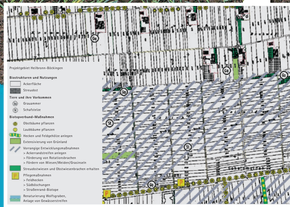
Auszug aus einem Biotopverbundplan

Das Ackerrand- streifen- Programm der Stadt Heilbronn