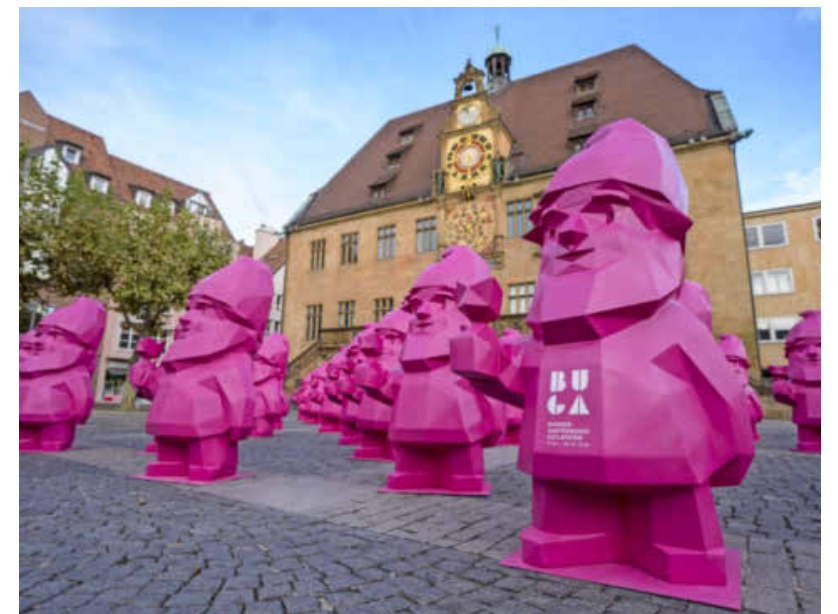
BUGA-Zwerg Karl, das Maskottchen der Gartenausstellung, eroberte nicht nur den Marktplatz der Stadt, sondern auch die Herzen der Heilbronner.