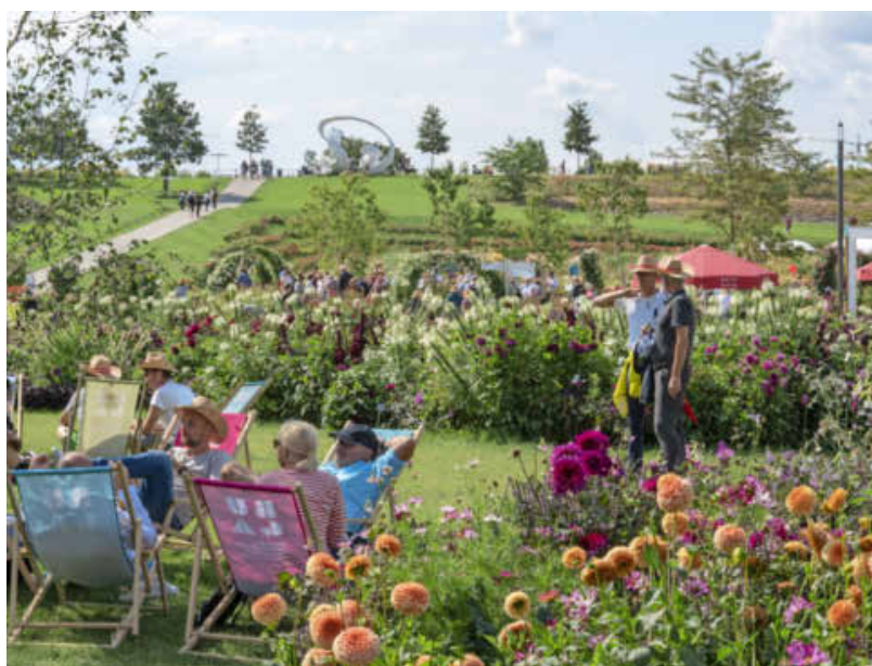
Nur wenige Gehminuten von der Innenstadt entfernt wurde die Bundesgartenschau 173 Tage lang zur grünen Oase im urbanen Raum.