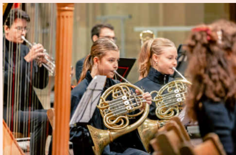
Die Musikschule bietet ein breites Programm an.

Alle Konzerte sind kostenfrei. Das Klassik Open Air ist eine Veranstaltung der Stadt Heilbronn und wird gefördert durch die Kulturstiftung der Kreissparkasse Heilbronn und durch die Heilbronner Bürgerstiftung. (red)