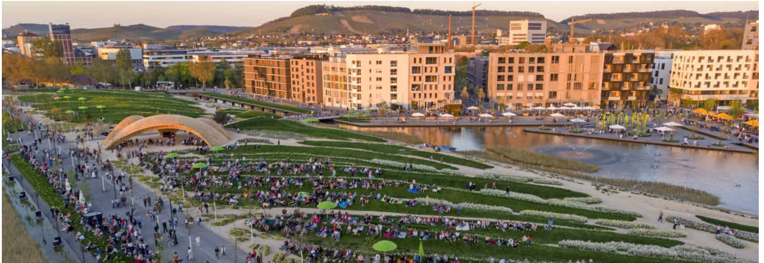
Jede Tageszeit auf der BUGA hatte ihre ganz eigene Magie. Besonders in den Abendstunden nutzten die Besucherinnen und Besucher die weitläufigen Grünanlagen, um sich mit Freunden zu einem Picknick zu treffen oder aber ein Glas Wein an einem der gastronomischen Stände zu trinken. Besonderer Clou: Wer abends aufs BUGA-Gelände gekommen war, durfte bleiben, so lange er wollte.