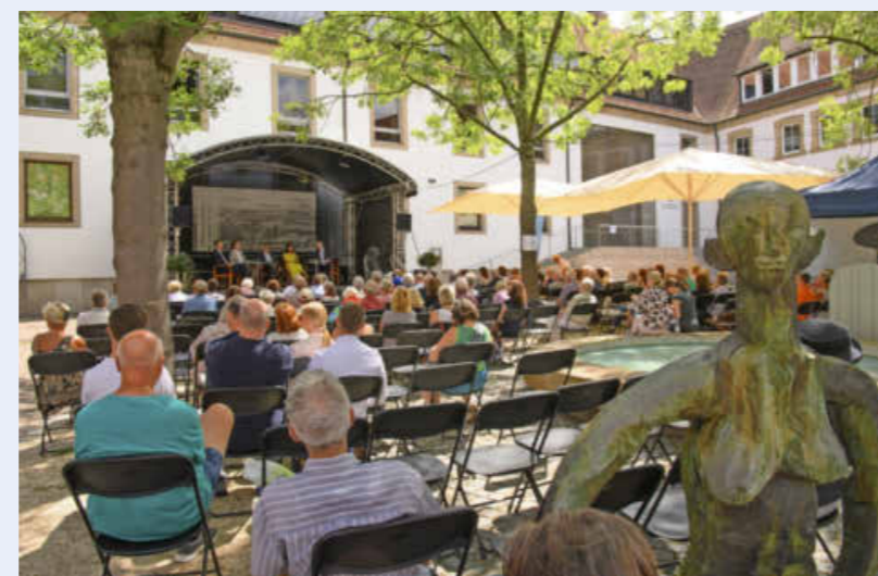
Die Wissenspause im Deutschhof ist sehr beliebt.

INFO: Weitere Infos unter museen.heilbronn.de