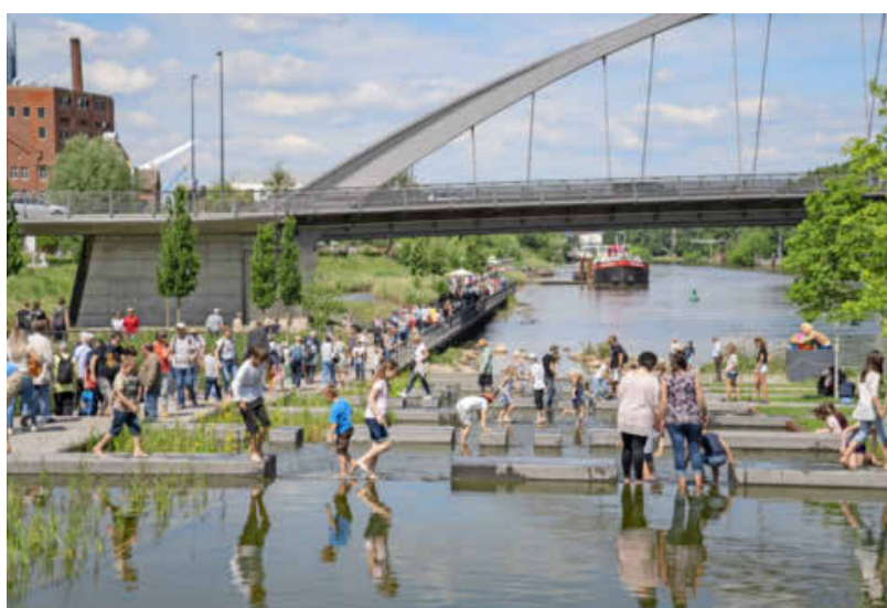
Das Motto „Stadt am Fluss“ rückte bei der BUGA wie selten zuvor den Neckar in den Fokus. 17 Hektar Grünanlagen entstanden entlang des Flusses.