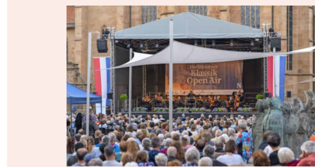
Das Klassik Open Air gehört zum Sommer.

Auch der LixClub-Lesesommer für junge Leserinnen und Leser von zehn bis 16 Jahren geht in diesem Jahr wieder in den Sommerferien an den Start. Anmeldung ab Dienstag, 16. Juni, in der Stadtbibliothek im K3. (red)