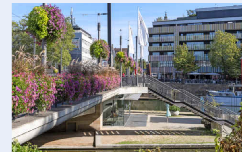
Am Wochenende ist die Inselspitze geöffnet.

INFO: Weitere Infos und Termine unter musikschule.heilbronn.de