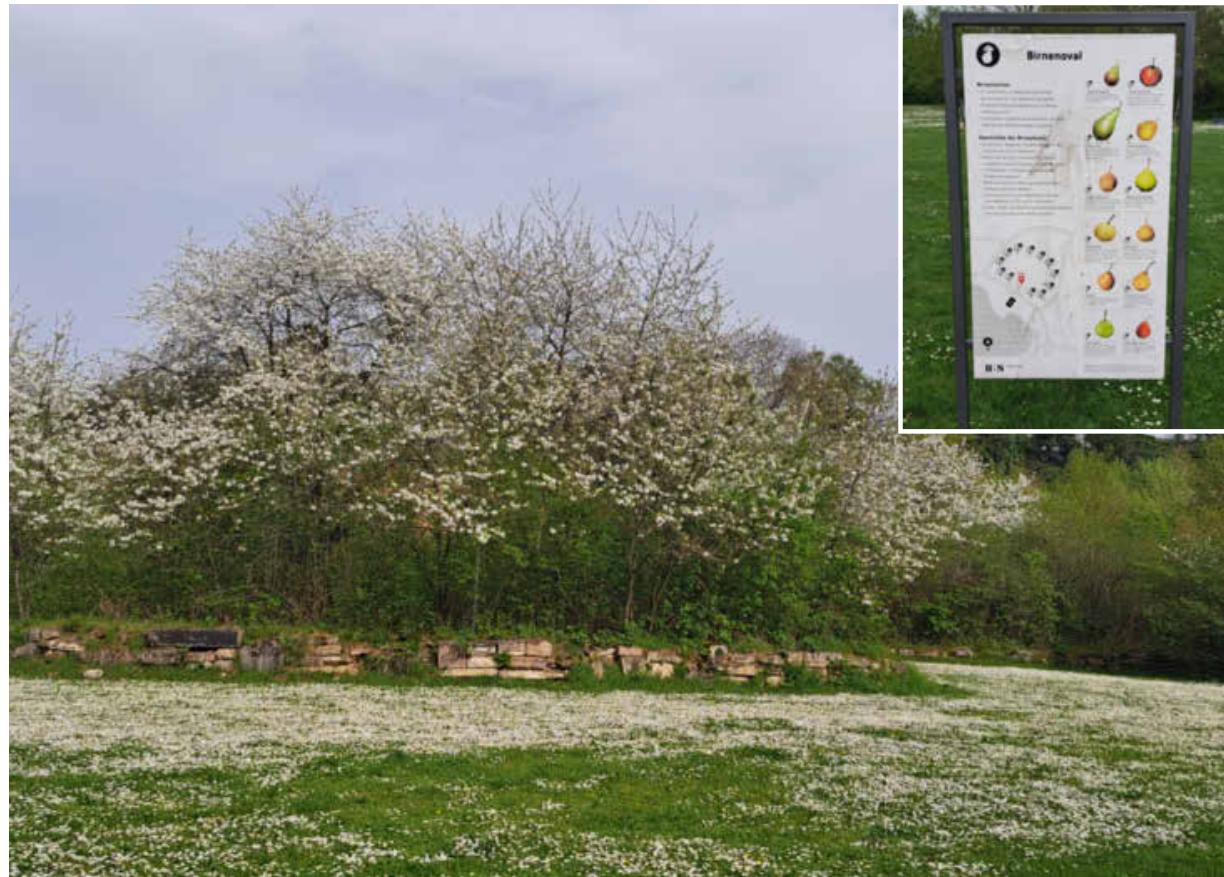
Blüten, Bienen und jede Menge Birnbäume: Auf dem Mostbirnenweg in Böckingen kann man dieser Tage viel erleben. Mit einem großen Spielplatz im Ziegeleipark ist für jeden etwas dabei.

Der Mostbirnenweg entstand 2019 bei der Aktion Stadtgrün für ein attraktives Grün in den Stadtteilen Heilbronn. Mehr als 118 verschiedene Wildbienenarten und seltene Birnenarten warten darauf, von Klein und Groß entdeckt zu werden. Die Streuobstwiesen werden mit hochstämmigen Obstsorten und Arten, meistens aus der Region, bepflanzt.