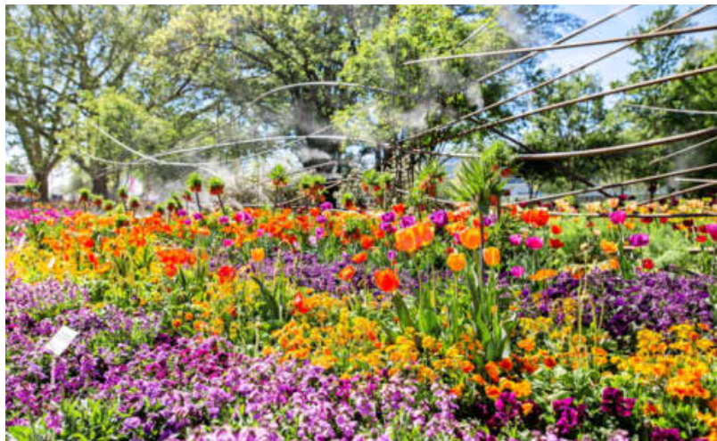
Ein Meer aus Tulpen: Eine ähnliche Pracht ist jetzt auch fünf Tage auf dem Heilbronner Marktplatz zu sehen.