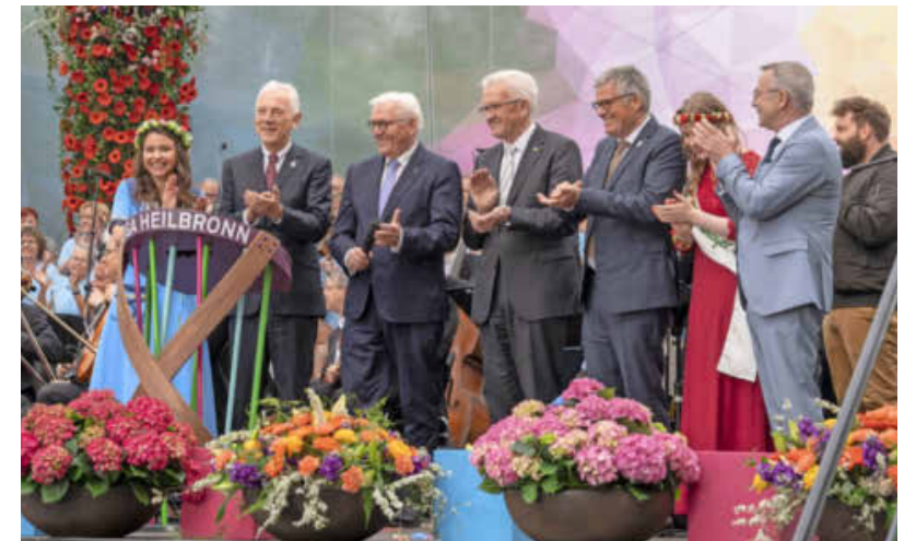
Zur Eröffnung der Bundesgartenschau 2019 kam mit Bundespräsident Frank-Walter Steinmeier auch hoher Besuch aus Berlin nach Heilbronn.