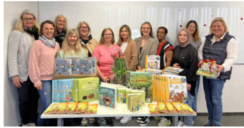
Glückliche Gesichter beim Eintreffen der Bücher.