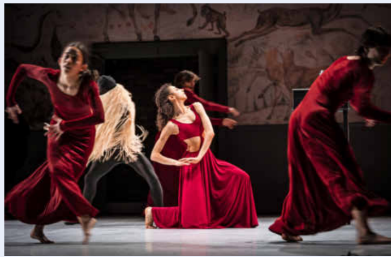
Die Tanz-Collage „Die Unsichtbaren“ ist ganz besonders.