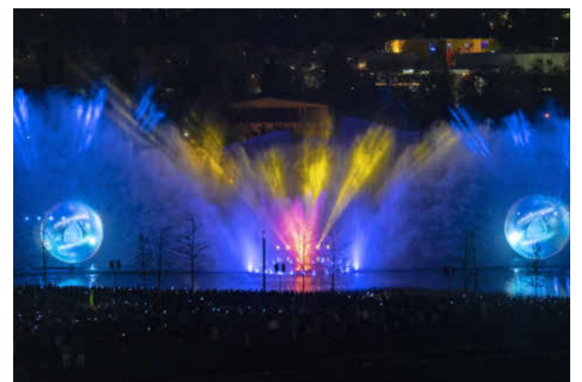
Bis heute unvergessen sind die spektakulären Wassershows, die in den Abendstunden den Karlssee hell erleuchteten.