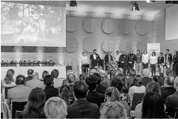
Bei der Preisverleihung im Stuttgarter Hospitalhof nahmen die Projektbeteiligten den Sonderpreis des Baden-Württembergischen Landschaftsarchitektur-Preis 2024 entgegen.