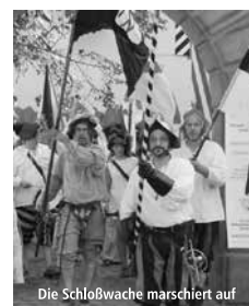
Die Schloßwache marschiert auf