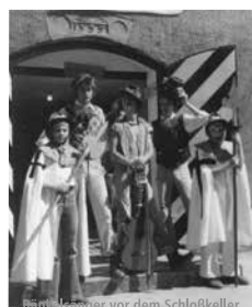
Bäckerknecht vor dem Schloßkeller