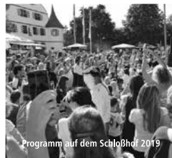
Programm auf dem Schloßhof 2019