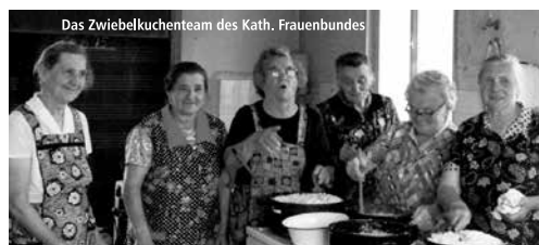
Das Zwiebelkuchenteam des Kath. Frauenbundes