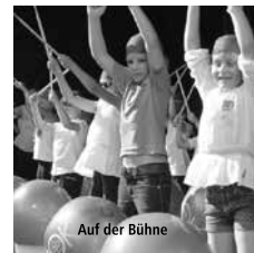
Auf der Bühne