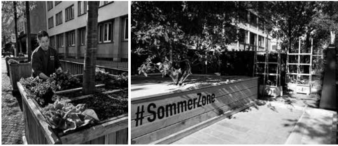
Bilder des Aufbaus

den, Institutionen und Vereinen genutzt werden. Anmeldungen sind möglich per E-Mail an sommerzone@heilbronn.de .