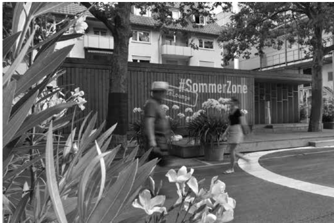
Auch in diesem Jahr wird die Turmstraße wieder zur #SommerZone

Die temporären Interventionen kommen jedoch auch den Bewohnerinnen und Bewohnern vor Ort zu Gute und schaffen zusätzlichen Platz in der Stadt für Austausch und Begegnung. Kleinere Aktionen und Präsentationen sind in beiden SommerZonen angedacht, unter anderem von der Stadtbibliothek und der städtischen Musikschule Heilbronn. Vom 1. bis 4. Juni findet StadtLesen statt, ein Lesefestival unter freiem Himmel, am 29. Juli das Straßenkunstfestival „KulturSamstag“. Zudem weitet die Heilbronner Bürgerstiftung ihre Aktion „spiel mich! Heilbronn“ mit künstlerisch gestalteten Klavieren auch auf die SommerZonen aus.