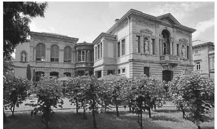
Die ehemalige Villa Faißt steht heute als Wein Villa Besuchern offen.

Ab jetzt ist das Buch in der Tourist-Information, Kaiserstraße 17, und in der Wein Villa, Cäcilienstraße 66, für zehn Euro erhältlich. Für die vom Schul-, Kultur- und Sportamt der Stadt Heilbronn umgesetzte Neuaufgabe wurde es inhaltlich und grafisch überarbeitet und um Aspekte der Restaurierung in den 1990er-Jahren ergänzt.