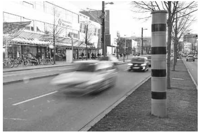
27.670 Autofahrerinnen und -fahrer wurden 2023 an festinstallierten Geschwindigkeitsmessgeräten, besser bekannt als Blitzersäulen, wie hier an der Allee geblitzt.