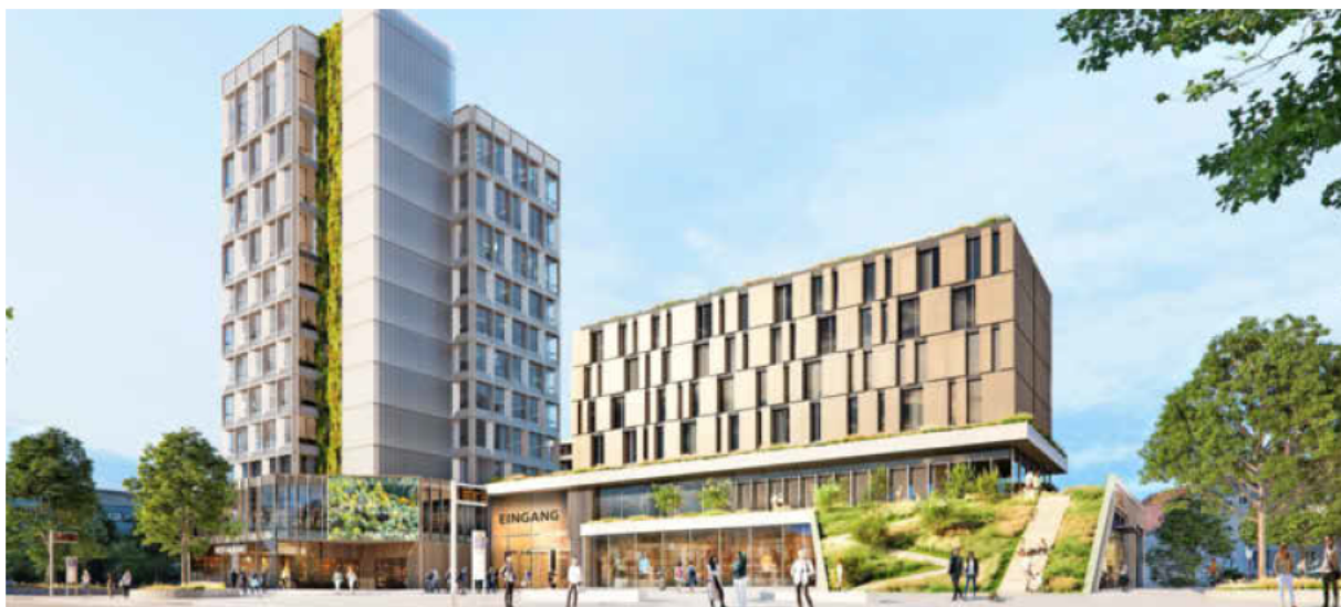
Kaum wiederzuerkennen: das Wollhaus mit neuer Fassadenverkleidung und ergänzt um einen Neubau, in dem ein Hotel Platz finden könnte.

Für das neue Wollhaus bleiben die vorhandenen Gebäude erhalten. Sie werden grundlegend umgebaut und um neue Bauten erweitert,