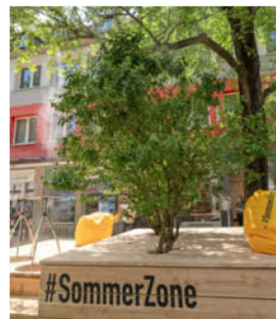
Die #Sommerzonen sorgen für grüne Akzente in der Stadt.

Die Turmstraße lockt bereits seit dem letzten Jahr mit einer einladenden Leselounge, attraktiven Bepflanzungen, gemütlichen Sitzgelegenheiten und vielfältigen