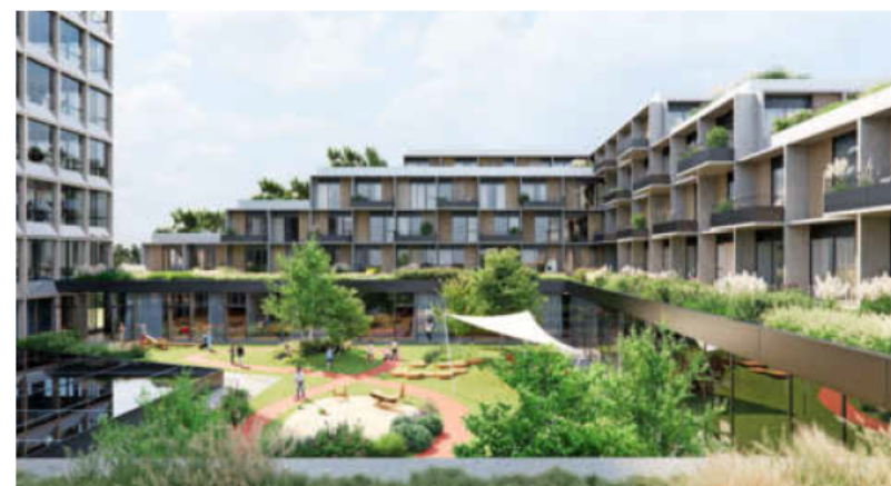
Auch ein L-förmiger Wohnriegel und ein großer begrünter Innenhof gehören zum Konzept des umgestalteten Wollhauses.