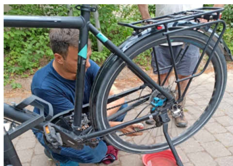
In der Fahrradwerkstatt Heilbronn bekommen Radfahrer fachliche Hilfe für die Reparatur ihres Fahrrads.

Eine Reparatur kann oft die Kosten für eine Neuanschaffung