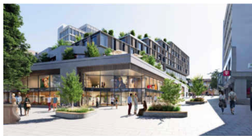
Der Eingang an der Fleiner Straße soll vergrößert werden, um seinen bisher „mauslochartigen“ Charakter zu verlieren.

Die Stadt Heilbronn begrüßt die Planungen und das Bekenntnis der Neufeld Immobilien GmbH zur Region. Im Rahmen der Neukonzeption des Wollhauses plant die Stadt, das öffentliche Umfeld des Areals neu zu gestalten. Dazu soll es einen freiraumplanerischen Realisierungswettbewerb geben. Auch soll untersucht werden, wie der Individualverkehr künftig geführt werden kann.