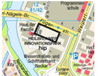
Kartengrundlage: Vermessungs- und Katasteramt

Heilbronn, 27.07.2023 Stadt Heilbronn Bürgermeisteramt In Vertretung Ringle Bürgermeister