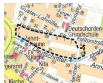
Kartengrundlage: Vermessungs- und Katasteramt

Stadt Heilbronn Bürgermeisteramt In Vertretung Hajek, Bürgermeister