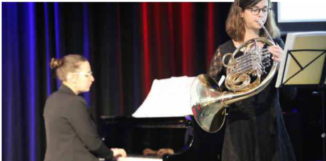
Von der Städtischen Musikschule Heilbronn erzielten 20 Schülerinnen und Schüler in 16 Wertungen insgesamt 21 Preise beim Landeswettbewerb „Jugend musiziert“.