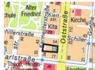
Kartengrundlage: Vermessungs- und Katasteramt

Stadt Heilbronn Bürgermeisteramt In Vertretung Hajek, Bürgermeister