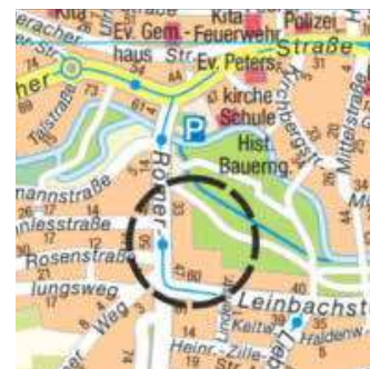
Kartengrundlage: Vermessungs- und Katasteramt

Stadt Heilbronn Bürgermeisteramt In Vertretung Hajek Bürgermeister