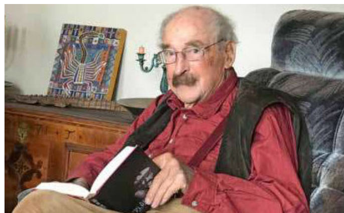
Am Donnerstag, 5. Mai, 19.30 Uhr, findet im Kinostar Arthaus eine Sondervorführung des Dokumentarfilms „Walter Kaufmann - Welch ein Leben!“ statt.

Der Theresienturm. Samstag, 30. April, 19 Uhr, Theresienwiese.