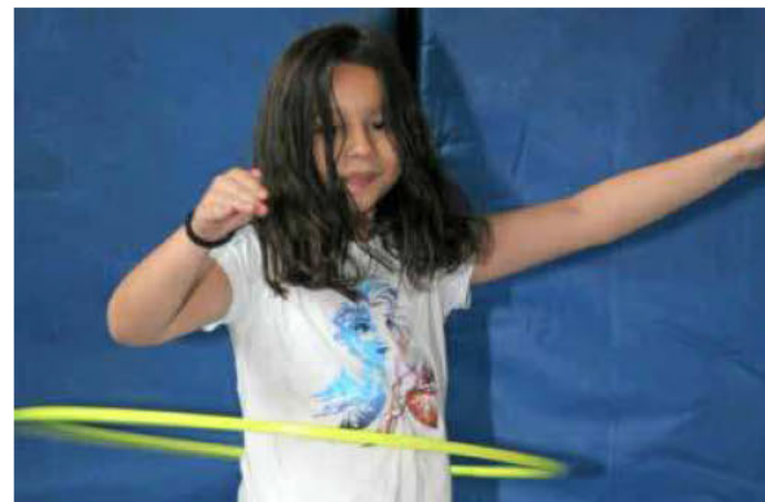
Kinder an der Grünewaldschule, an der Grundschule Alt-Böckingen sowie an der Rosenau- und Wartbergsschule erhalten Bewegungs- und Spielangebote.