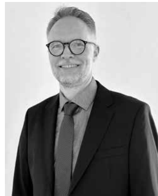
Patrik Henschel freut sich nach der Wahl auf die neuen Aufgaben bei der Stadt Heilbronn.