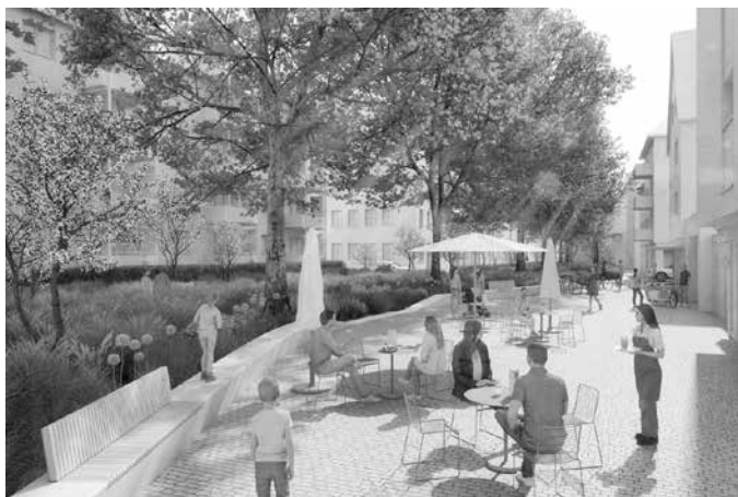
Visualisierung der Sanierungsvorschläge für die Turmstraße sowie Zehentgasse. Visualisierung: Arbeitsgemeinschaft Blau Grün/Stadt Heilbronn