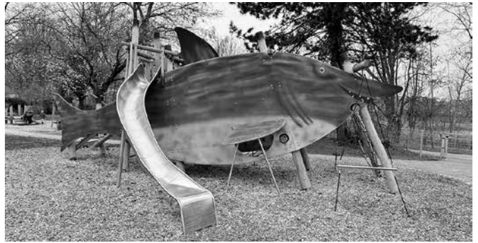
Auf dem neuen Haifisch-Klettergerüst können sich die Kinder so richtig austoben.

Sontheim ist um eine attraktive Spielgelegenheit reicher: Seit Anfang Februar können auf dem neu gestalteten Spielplatz Fischerheim in der Horkheimer Straße große und kleine Kinder wieder spielen und toben. Das Gelände wurde saniert und die Spielgeräte ausgetauscht. Bei der Neugestaltung wurden auch Wünsche und Ideen berücksichtigt, die im Rahmen einer Bürgerbeteiligung geäußert wurden. Sobald alle kleineren Restarbeiten abgeschlossen sind, wird es voraussichtlich Ende Juni eine offizielle Eröffnungsfeier geben, zu der alle Spielplatzfreunde eingeladen sind.