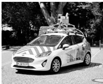
Vollausgestattetes Aufnahme-fahrzeug mit spezieller Kamera und Laserscanner.