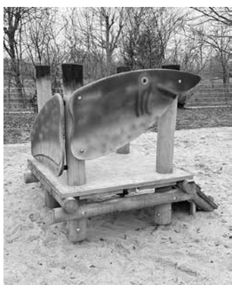
Auch für Kleinkinder ist nun mit dem Mini-Haifisch etwas geboten.

Sontheim ist um eine attraktive Spielgelegenheit reicher: Seit Anfang Februar können auf dem neu gestalteten Spielplatz Fischerheim in der Horkheimer Straße große und kleine Kinder wieder spielen und toben. Das Gelände wurde saniert und die Spielgeräte ausgetauscht. Bei der Neugestaltung wurden auch Wünsche und Ideen berücksichtigt, die im Rahmen einer Bürgerbeteiligung geäußert wurden. Sobald alle kleineren Restarbeiten abgeschlossen sind, wird es voraussichtlich Ende Juni eine offizielle Eröffnungsfeier geben, zu der alle Spielplatzfreunde eingeladen sind.