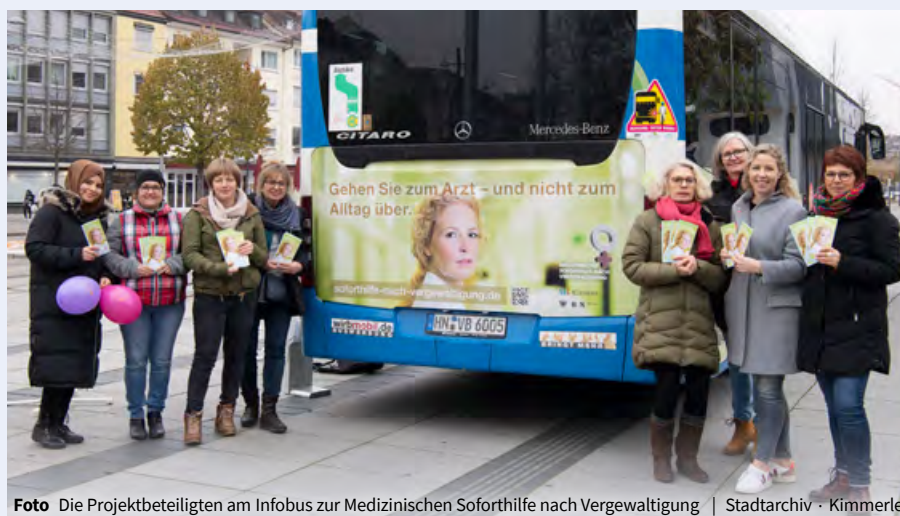
Foto Die Projektbeteiligten am Infobus zur Medizinischen Soforthilfe nach Vergewaltigung

Mehr: www.muettergenesungswerk.de/spenden-engagieren